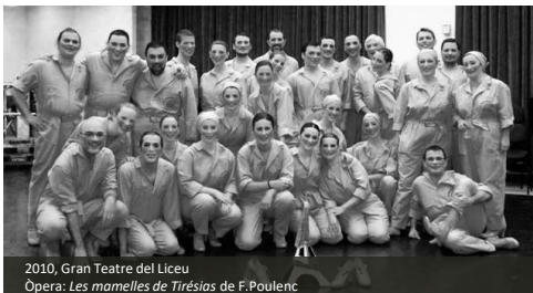
2010, Gran Teatre del Liceu Òpera: Tes mamelles de Tirésias de F.Poulenc