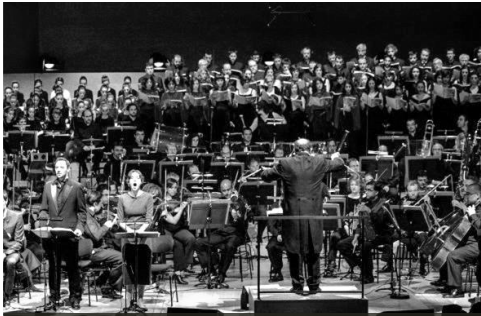
2012, L'Auditori Jeanne d'Arc au Bûcher d'A. Honneger amb l'OBC i Marion Cotillard