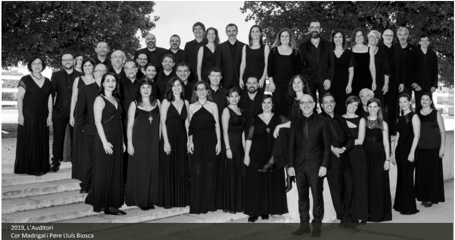
2019, L'Auditori Cor Madrigal i Pere Lluís Biosca