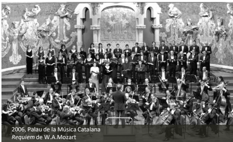
2006, Palau de la Música Catalana Requiem de W.A.Mozart